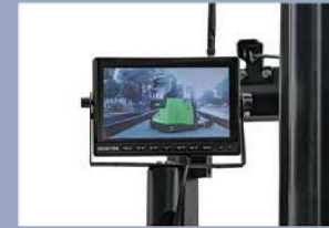
Kamerasysteme zum Fahren