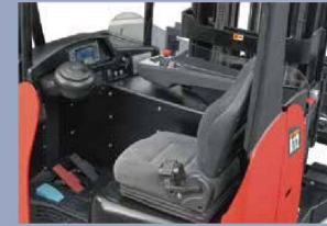
Mit dem ergonomischen Designkonzept von HANGCHA wurde eine perfekte Schnittstelle zwischen Fahrer und LKW erreicht