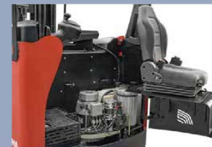
Die vollständig geöffnete Tür ermöglicht eine einfache Reparatur und Wartung