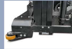
Schienen- oder Drahtführung